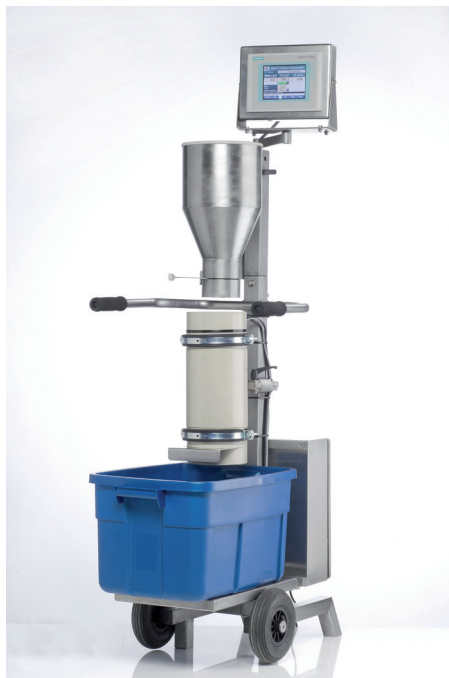
Afb. 2 Een off-line vochtmeter met bulkdichtheidsmeting

Zoals bij alle hoogfrequent-technieken wordt feitelijk de hoeveelheid water per volume-eenheid bepaald. “Dit levert echter nog geen vochtpercentage op”, legt Coolen uit. “De hoeveelheid product per volume-eenheid kan namelijk variëren, afhankelijk van de bulkdichtheid. Om het vocht massapercentage te bepalen, is het dus nodig om de hoeveelheid water per volume-eenheid te delen door de hoeveelheid product per volume-eenheid, ofwel de bulkdichtheid.”